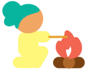
Spelen op gevaarlijke plekken